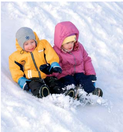
Kuigi päike oli hoolega lund sulatamas, ei seganud see pikima liu võistlust. Mõnel pisikesel trallitajal jätkus liulusti pärast võistluse lõppemistki.