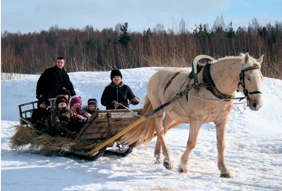
Kes soovis, sai saaniga vastlasõitu teha. Hobune oli kohale toodud Läänemaalt Ranna Rantšost.

12. märtsil peeti vallamaja ümbruses maha traditsiooniline vastlatrall. Trallitajate hulgas oli seekord palju mudilasi ja omajagu täiskasvanuid. Omavahel võeti mootu lisaks hokile ja tõukekelgutamisele ka täpsusviskes ja liulaskmises. Ninasoojendamiseks pakuti teed ja hernesuppi, maiustamiseks ube ja muidugi vastlakukleid. Toitlustamise eest hoolitsesid vallavalitsus, Sauga Lion's Club ja Õie Kukk. Muusikat tegid Sauga noortekeskuse diskorid.