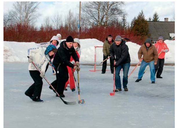
Päeva lõpetuseks peeti maha äge hokilahing Sauga valla võistkonna ja Sauga Lions Club'i vahel. Seekord jäi peale vald, kuigi lõvide värava-vahat oli oma puuri kaitsel kui lõvi.