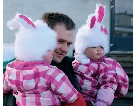
Vastlapäeva kõige pisemad osalised nautisid päeva täiel määral.

12. märtsil peeti vallamaja ümbruses maha traditsiooniline vastlatrall. Trallitajate hulgas oli seekord palju mudilasi ja omajagu täiskasvanuid. Omavahel võeti mootu lisaks hokile ja tõukekelgutamisele ka täpsusviskes ja liulaskmises. Ninasoojendamiseks pakuti teed ja hernesuppi, maiustamiseks ube ja muidugi vastlakukleid. Toitlustamise eest hoolitsesid vallavalitsus, Sauga Lion's Club ja Õie Kukk. Muusikat tegid Sauga noortekeskuse diskorid.