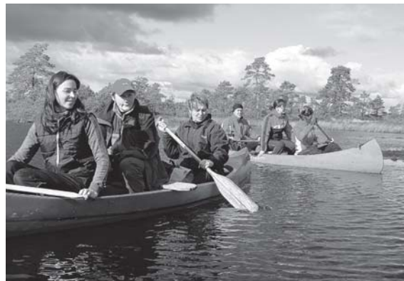
Käesolevat hooaega alustasid valla usinamad sportlased kanuumatkaga Võlla raba laugastel

Lastel ja peredel on Sauga valla spordiloos olnud väga tähtis koht. 1995. aastal pandi alus valla laste suvistele laagritele, mis tänaseks on läbinud suuri muudatusi, kuid endiselt hõlmavad endas sportlike alasi ja mängu. Vastlapäevast on kujunenud lustlik perepäev, mille korraldamisel on abiks olnud Sauga Lions Club ja mitmed vallaasutused. 10. aastat järjest, võistlevad noored kompleksvõistluse erinevatel aladel, mis peädib